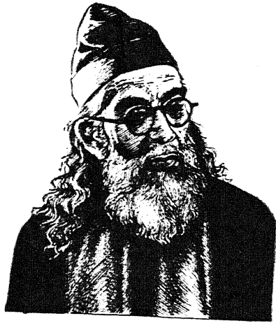
खवाजा हसन निजामी